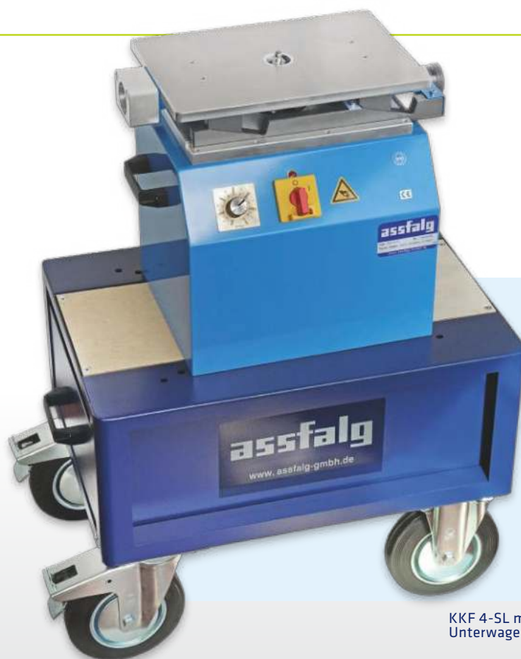
KKF 4-SL mit Unterwagen