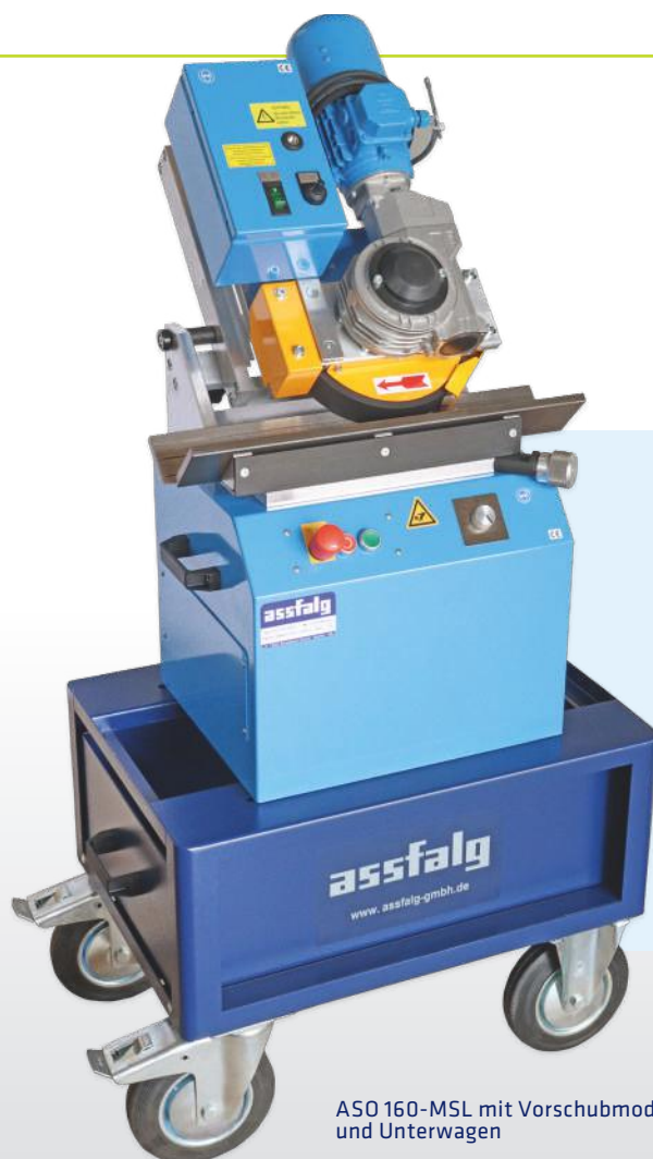
ASO 160-MSL mit Vorschubmodul und Unterwagen