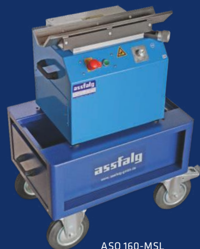
ASO 160-MSL mit Unterwagen