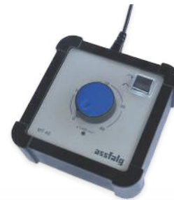
Steuereinheit MT40 Steuereinheit MTQ100

Die handlichen und leistungsstarken Elektroschleifer sind für individuelle Einsatzfälle beim Entgraten, Trennen, Schleifen und Polieren optimal geeignet. Durch eine große Auswahl an Schleif- und Frässtiften können schwer erreichbare Stellen und 3D-Formen ideal bearbeitet werden.