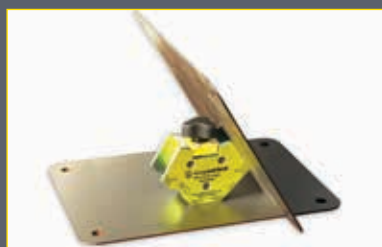
Mini Multi, schaltbar