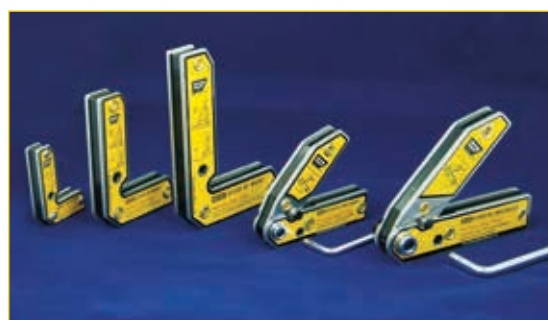
MLDT | MLA